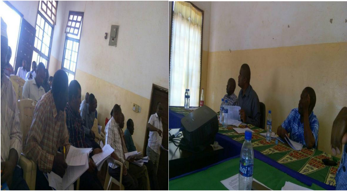
Kielelezo Na. 1: Picha ya kushoto inamuonesha mjumbe wa DBC akiwasilisha jambo katika kikao cha wadau. Picha ya kulia ni wajumbe wa DBC wakiwa wakijadiliana jambo muhimu kuhusu biashara.